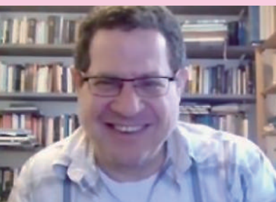
Haim Weiss 氏

【講師】 Haim Weiss（ネゲヴ・ベン＝グリオン大学ヘブライ文学部教授） Shira Stav（ネゲヴ・ベン＝グリオン大学ヘブライ文学部上級講師） 【日時】 2022年12月4日（日）16:00-17:30 【会場】 Web会議システム“Zoom”プラットフォーム